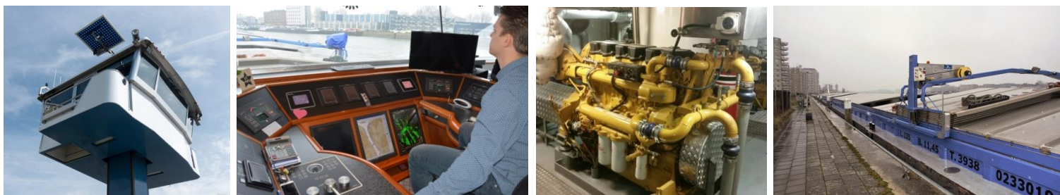
Från vänster; pråmfartygens höj- och sänkbara styrhytt (som klarar lägre brohöjder), dess avancerade bryggutrustning, pråmfartygets lastbilmotor och bulkpråmen som utnyttjar enklare kajlägen centralt i urbana miljöer. Pråmfartygen samspelar med samhället på samma sätt som lastbilen och utgör en länk mellan trafikslagen.

Pråmtrafik ger möjlighet att lyfta stora mängder gods från land till sjö i city- och regionlogistiken och bidrar därmed med motsvarande fördelar för samhälle och varuägare. I tillägg kan den större kustområdet flytta terminaler längre in i landet och därmed minska belastning på landinfrastrukturen runt själva hamnområdet. Pråmtrafiken blir länkar mellan trafikslagen.