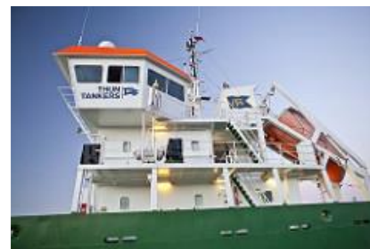
MS Eken, en av Thunbolagens torrlastare i Vänermax-storlek (max 89 m långa och 13,4 m breda), är ett exempel på den småskaliga IMO-sjöfarten. Fartyget med 4 800 dwt är anpassat för slussarna i Trollhättan.